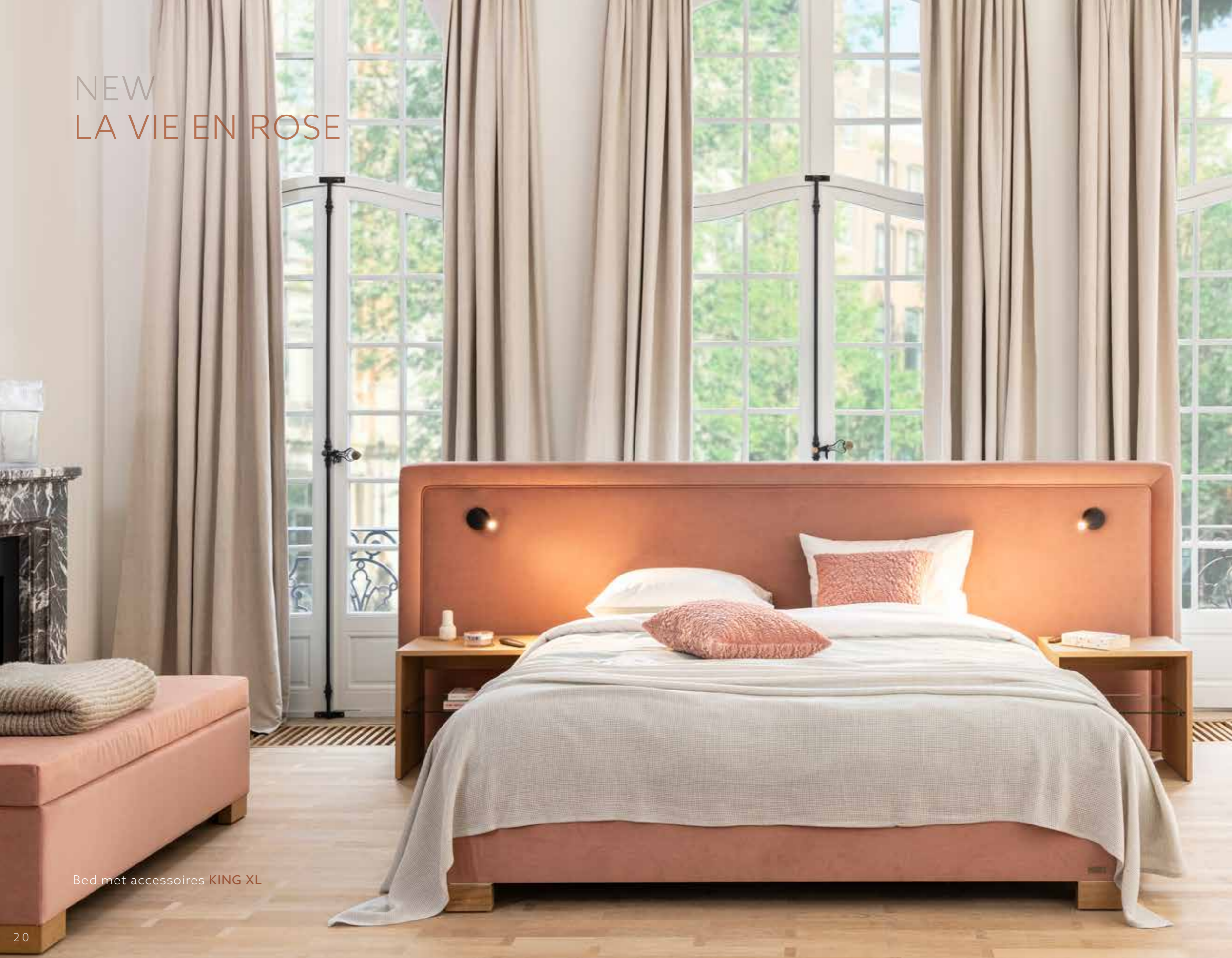
Bed met accessoires KING XL