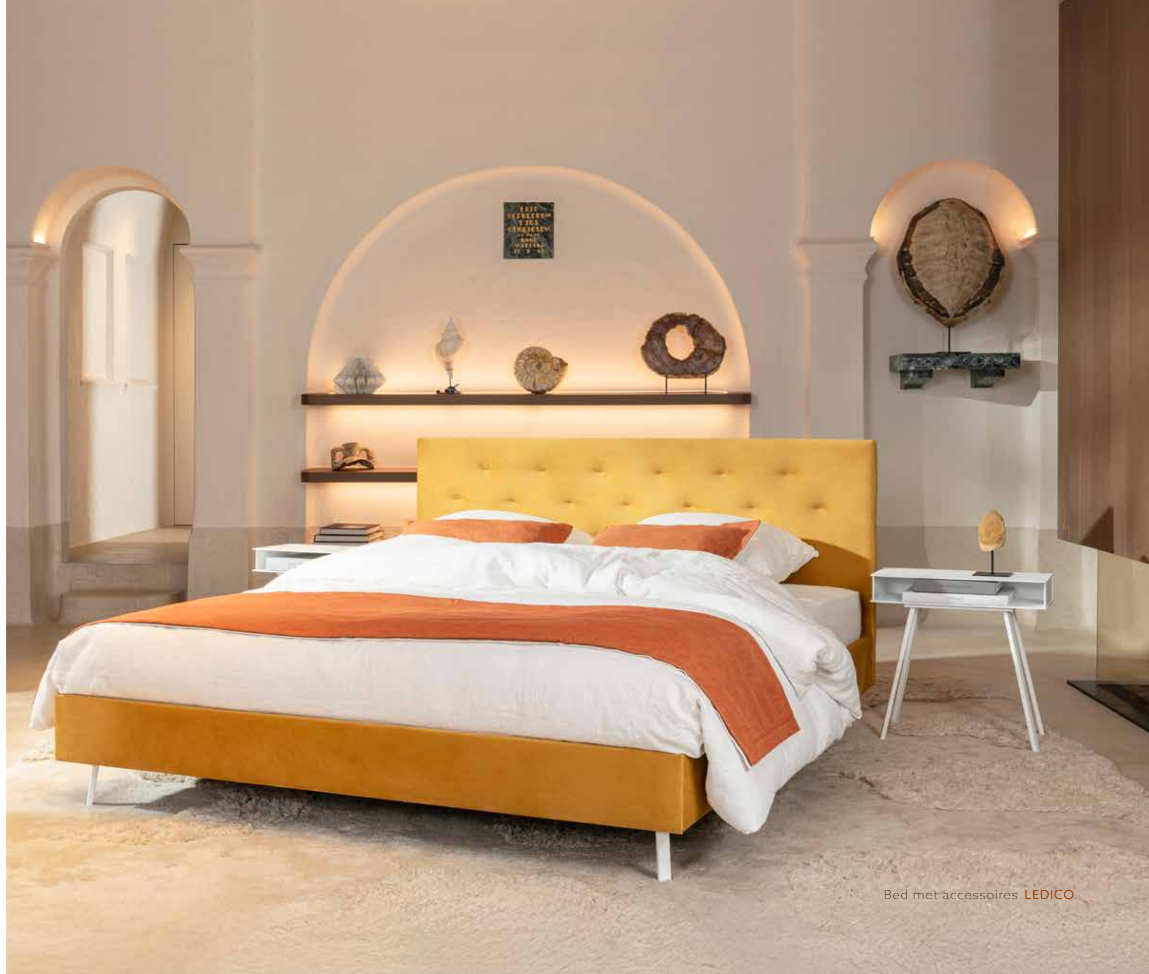
Bed met accessoires LEDICO